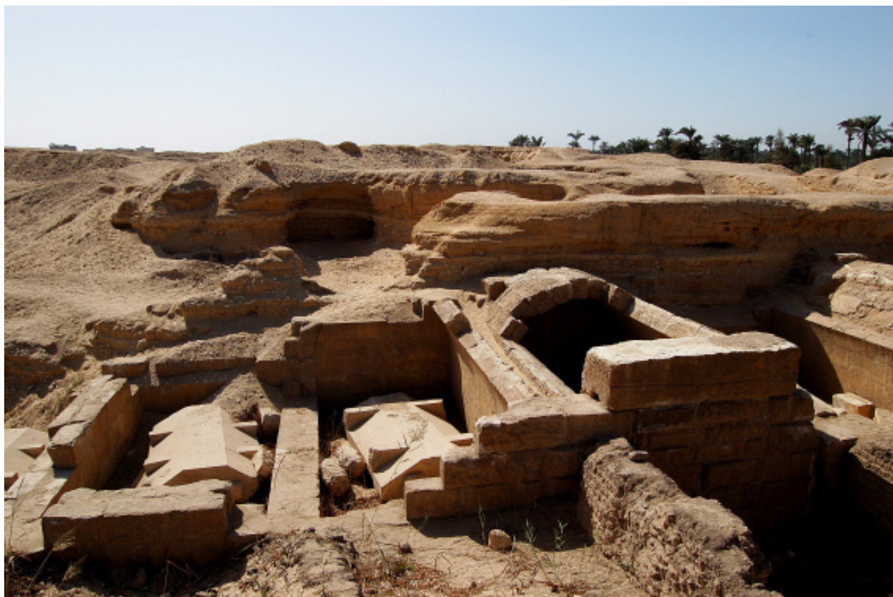
Le chantier archéologique d'Atfih (Université Paul-Valéry ; Université de Hérouville)